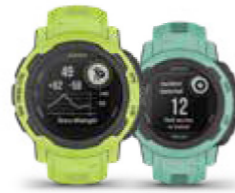
INSTINCT® 2 / 2S REGULAR E SOLAR