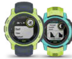
INSTINCT® 2 / 2S EDIÇÃO: SURF