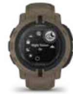
INSTINCT® 2 SOLAR