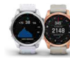
FÊNIX® 7S (REGULAR, SOLAR, ZAFIRO)