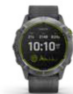
ENDURO™ Bisel 51 mm Correa Quickfit 26mm