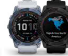
FÊNIX® 7X (SOLAR, +ZAFIRO SOLAR)