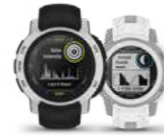
INSTINCT® 2 / 2S EDIÇÃO: TÁTICA