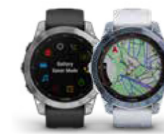
FÊNIX® 7 (REGULAR, SOLAR, ZAFIRO)